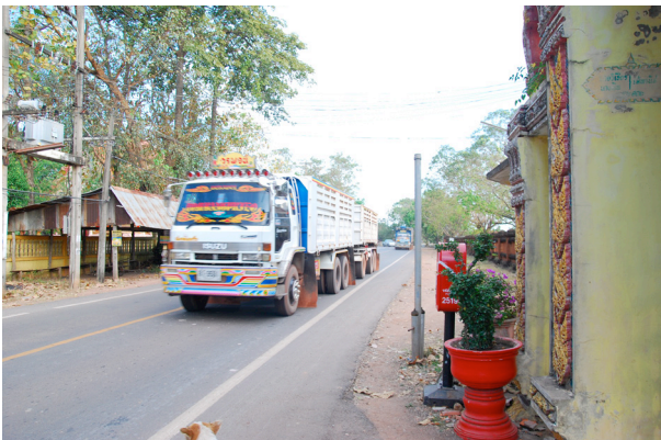
การตัดถนนผ่านกลางวัดต้นโพธิ์ศรีมหาโพธิ์ทำให้วัดแบ่งเป็น ๒ ส่วน นอกจากนั้นการสัญจรของยวดยานพาหนะโดยเฉพาะรถบรรทุกที่มีน้ำหนักมากย่อมทำให้เกิดแรงสั่นสะเทือนส่งผลให้แหล่งศิลปกรรมเสียหายได้