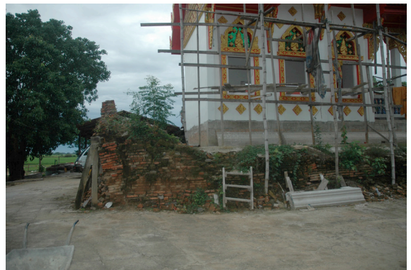
การสร้างโบสถ์ใหม่ทับไปบนฐานโบสถ์เก่าวัดหนองชะโด จังหวัดสิงห์บุรี ทำให้โบราณสถานเสื่อมคุณค่า