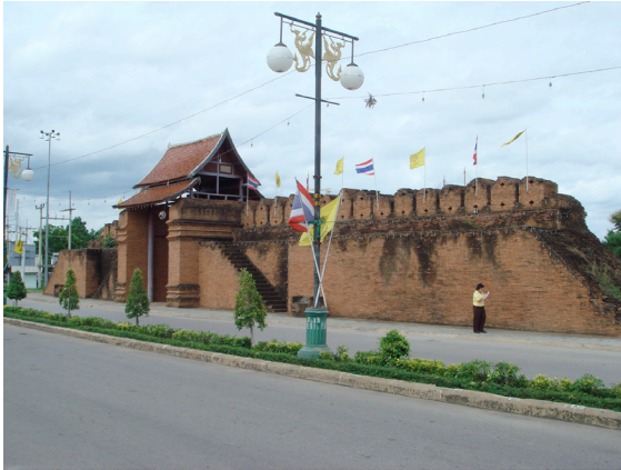
การสร้างกำแพงและประตูเมืองลำพูนขึ้นใหม่โดยมิได้ศึกษารูปแบบเดิมทำให้ขาดความเป็นของแท้