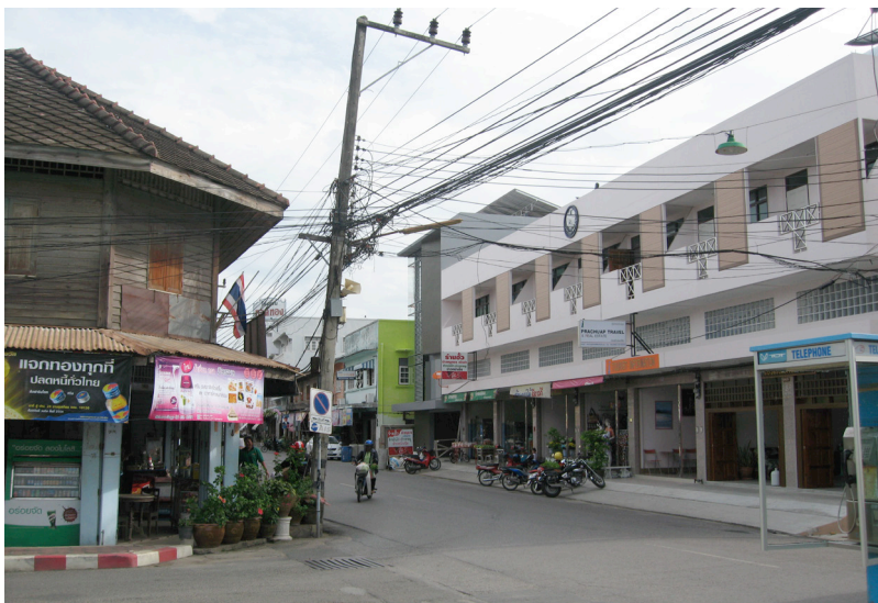
อาคารเก่าในย่านเมืองเก่าประจวบคีรีขันธ์ถูกรื้อสร้างใหม่ตามนโยบายของหน่วยงานที่เป็นเจ้าของกรรมสิทธิ์ที่ดิน ซึ่งไม่กลมกลืนกับสถาปัตยกรรมพื้นถิ่นของเมืองเก่า

๔) กรรมสิทธิ์ที่ซับซ้อน เนื่องจากอาคารที่มีคุณค่าหลายแห่งไม่ได้ตั้งอยู่บนที่ดินของเอกชน แต่อยู่บนที่ดินของสำนักงานทรัพย์สินส่วนพระมหากษัตริย์ ที่ราชพัสดุ หรือที่ตั้งอยู่ในความดูแลของหน่วยงานอื่นๆ จึงทำให้การอนุรักษ์และฟื้นฟูมีข้อจำกัดตามองค์กรที่เป็นเจ้าของกรรมสิทธิ์ที่ดินนั้นๆ ด้วย