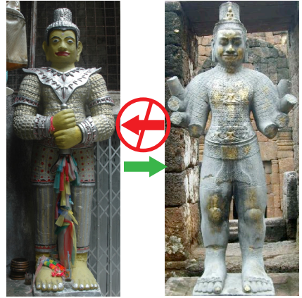
การซ่อมเทวรูปพระโพธิสัตว์อวโลกิเตศวรแปลงรัศมีจากของเดิม (รูปขวา) เป็นของใหม่ (รูปซ้าย) โดยตัดแปลงจากของเดิมทำให้คุณค่าเสื่อมลงอย่างมาก