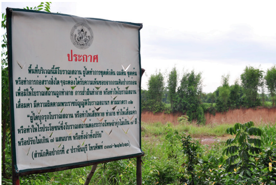
โบราณสถานในเมืองศรีมโหสถถูกขุดค้นทำลาย ด้วยกิจกรรมการขุดดินลูกรัง

๑) การขุดค้น ทำลาย รื้อถอนแหล่งมรดกทางวัฒนธรรม รวมทั้งการทำให้แหล่งศิลปกรรมเสื่อมคุณค่าในรูปแบบต่างๆ เป็นการทำให้เมืองเก่าเสื่อมคุณค่าลงด้วยเช่นเดียวกัน