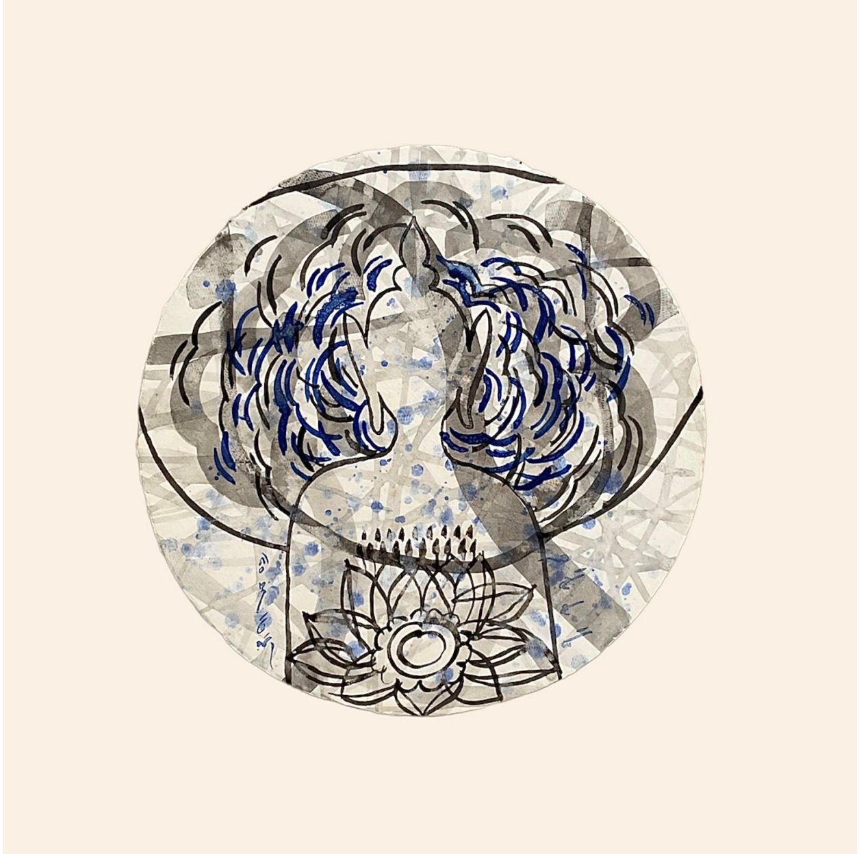
สีอะครีลิค ดินสอดำ บนกระดาษสา ขนาด เส้นผ่านศูนย์กลาง ๒๖ เซนติเมตร